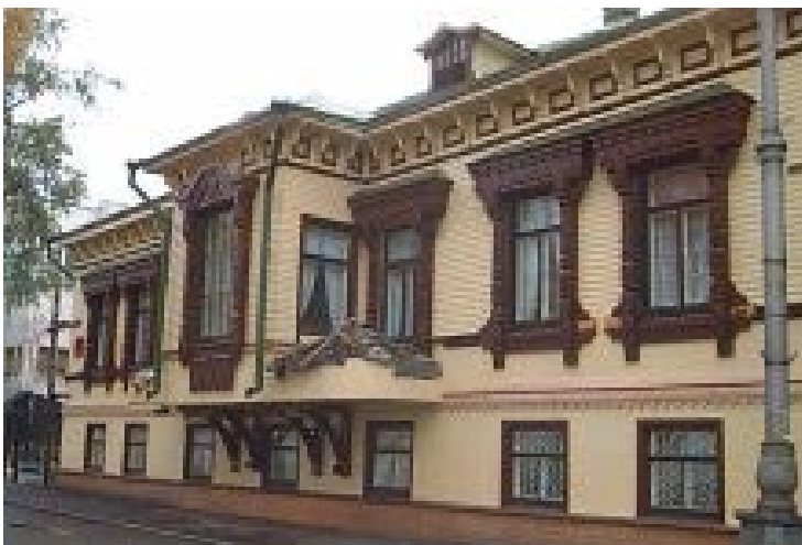
Eine restaurierte Villa des 19. Jahrhunderts im heutigen Archangelsk.

Wassili Ossipowitsch Rachoff wurde 1861 geboren und war der Sohn geachteter Bürger in Archangelsk, einer Stadt zwischen der Tundra und dem Weißen Meer. Seine Eltern waren wohlhabende, reiche Leute, die in einem steinernen Stadthaus nahe dem Hafen wohnten. Der Vater war Kaufmann und der Sohn sollte nun in seine Fußstapfen treten. In seinem siebzehnten Jahre ging Rachoff täglich auf die Schreibstube eines großen deutschen Exportlagers, um bei den befreundeten Handelsherren die Kaufmannschaft zu lernen.