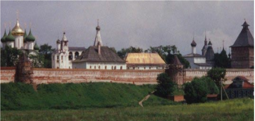
Blick auf das Susdalkloster von außerhalb der dicken Mauern.

auf dem der arme Gefangene lag. Die Wände waren feucht, im Winter gefroren sie. Ein kleines hohes vergittertes Fenster, nie geöffnet, gab trübes Kellerlicht. Nur unregelmäßig bekam der Gefangene zu essen. Fieberfröste durchrasten bald seinen armen, abgezehrten Körper. Ihn, der so viele gepflegt hatte, pflegte niemand.