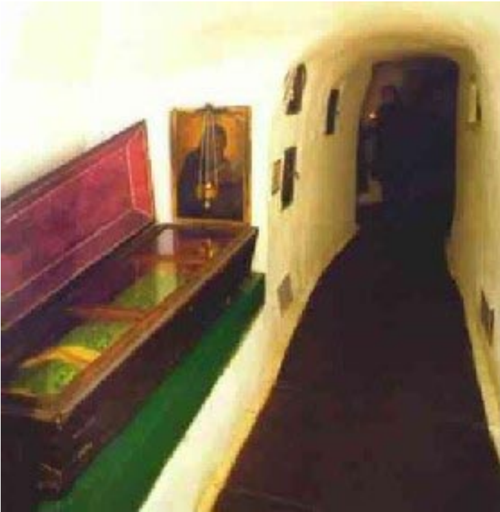
Ein Gang durch die Katakomben von Lavra, wo die Särge der Heiligen noch immer Scharen von Touristen und Pilgern anziehen.

halten oder ob sie ersetzt werden müssen. Hat so ein Leichnam fünfzehn oder zwanzig Jahre gelegen, beginnt er zu verfallen. Er stinkt und fault an den Fersen und an den Lippen. Sie müssen die ausgesonderten, schlecht gewordenen Leichname des Nachts auf die Schulter