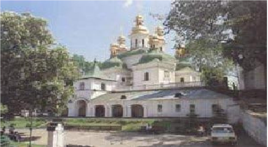
Eine der vielen Kirchen aus denen Kiews altes Lavra Kloster entsteht

Rachoff wirkte lange Zeit in den armen Vorstädten. Aber wenn er von Jesus sprach, lachten ihn die meisten aus und sagten gestrost: „Wir hier in Kiew brauchen deinen Jesus nicht, wir haben ja hier die heiligen Mumien, die retten uns!“