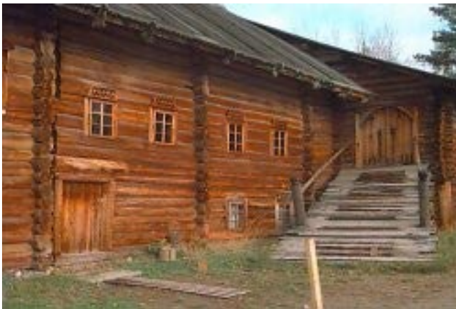
Eine Blockhütte aus dem 19. Jahrhundert bei Kiew.

Rachoff fand einen alten Mann mit geschwollenen Füßen, der auf der Ofenbank lag und Felle um die Beine gewickelt hatte.