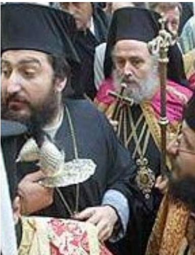
Eine griechisch-orthodoxe Prozession auf dem Weg durch das heutige Jerusalem

Es war eine große Prozession, und der griechische Patriarch, auf weißseidenem Throne hochgetragen von vier Priestern, zog wie eine weiße Wolke unter Fanfarenschall in die griechische Kirche ein und wurde vor dem Altar niedergesetzt. Da aber erhob